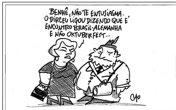
Figura 3 - Charge publicada pelo JSC em 08 de novembro de 2007

Os acessórios na roupa de Lula (o chapeuzinho alemão e o caneco) remetem à Oktoberfest, segunda maior festa alemã do mundo. Desenvolvida desde 1984, no mês de outubro (como o nome revela), faz parte do calendário cultural e turístico de Santa Catarina e já se consolidou como um dos mais importantes produtos turísticos nacionais. A festa, na qual se pode saborear bons chopes, é realizada no Parque Vila Germânica de Blumenau – centro de eventos onde foi desenvolvido o Encontro Brasil-Alemanha (GLOBO ONLINE. 2007).