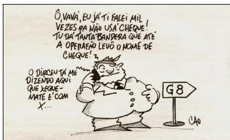
Figura 2 - Charge publicada pelo JSC em 6 de junho de 2007

Para entender essas falas, é preciso ter conhecimento sobre dois fatos noticiados pela imprensa na data de publicação da charge e também nos dias anteriores. Nesse período, os jornais brasileiros destacaram a visita oficial de Lula à Índia e sua participação no Encontro