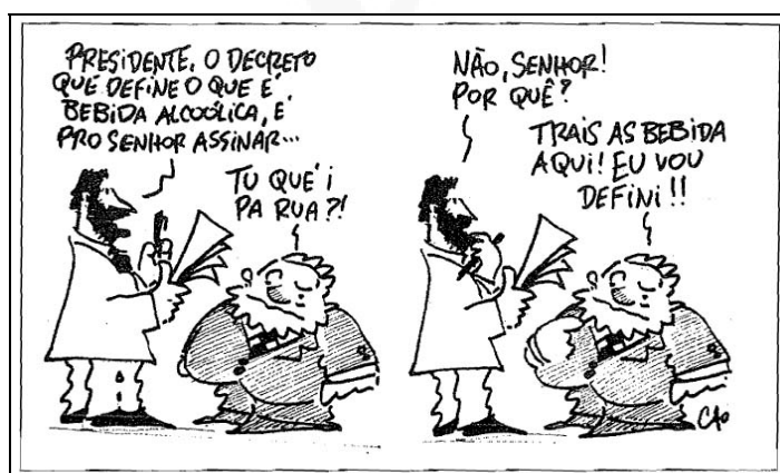
Figura 1 - Charge publicada pelo JSC em 23 de maio de 2007

No dia anterior, a imprensa já havia sido avisada de que o governo federal lançaria, na manhã seguinte, a política nacional sobre álcool, um conjunto de medidas para prevenir o consumo excessivo de bebidas alcoólicas e ampliar o acesso a tratamento para pessoas dependentes. (AGÊNCIA BRASIL. 2007a).