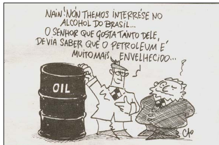
Figura 5 - Charge publicada pelo JSC em 20 de novembro de 2007

Numa leitura dos textos jornalísticos publicados na época, observa-se que o uso de biocombustíveis entrou na pauta de discussões do encontro. A imprensa noticiava o empenho dos dois países em estabelecer processos de cooperação na produção e utilização de álcool etílico (etanol), uma forma de reduzir a dependência do petróleo, recurso esgotável e, portanto, escasso, o que faz os preços subirem quando a demanda aumenta (JORNAL DO BRASIL. 2007).